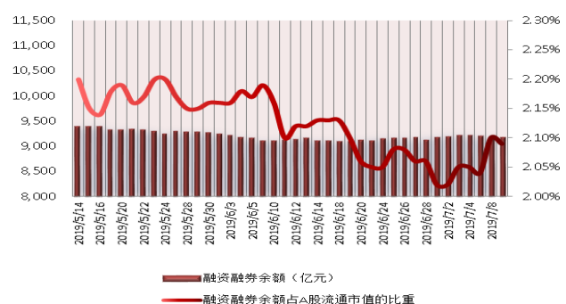
图 2：近三十个交易日融资融券余额及占 A 股流通市值的比重