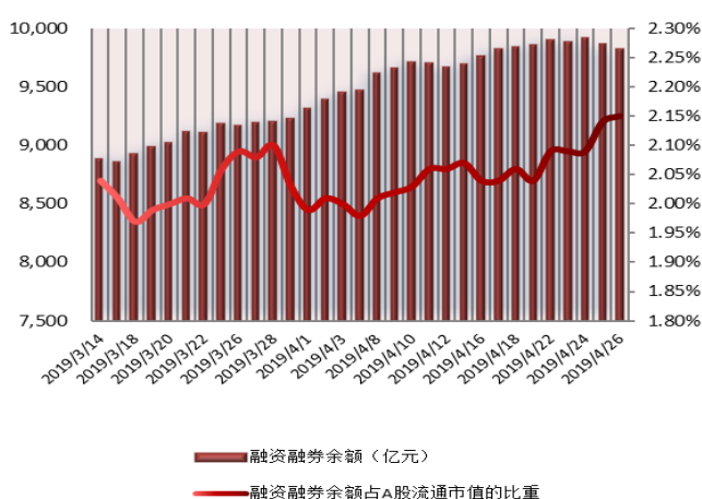
图2：近三十个交易日融资融券余额及占A股流通市值的比重