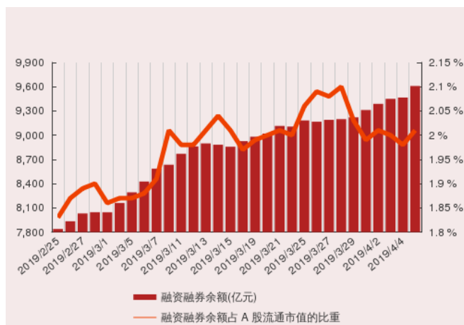
图2：近三十个交易日融资融券余额及占A股流通市值的比重