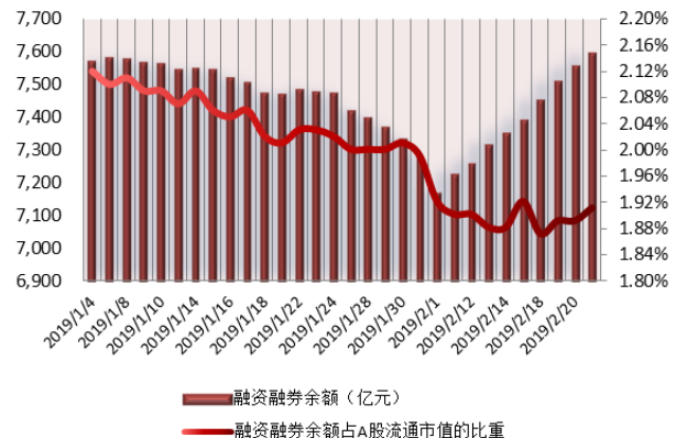
图 1: 近三十个交易日融资融券交易金额及占 A 股交易额的比重