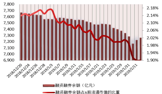
图2：近三十个交易日融资融券余额及占A股流通市值的比重