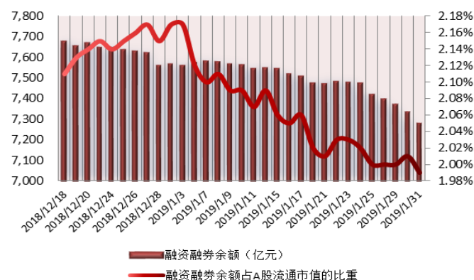
图 1：近三十个交易日融资融券交易金额及占 A 股交易额的比重