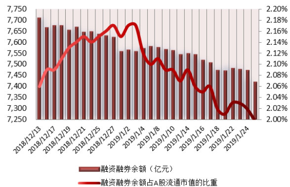
图 1：近三十个交易日融资融券交易金额及占 A 股交易额的比重