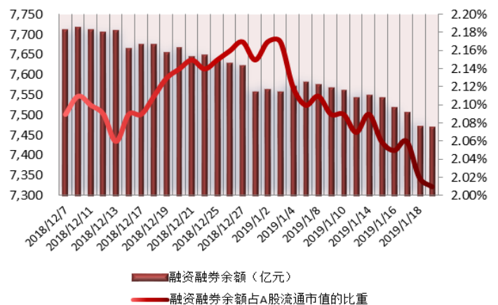
图 2: 近三十个交易日融资融券余额及占 A 股流通市值的比重