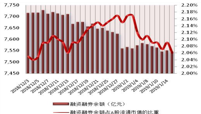
图 1：近三十个交易日融资融券交易金额及占 A 股交易额的比重