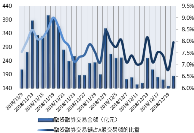
图 1: 近三十个交易日融资融券交易金额及占 A 股交易额的比重