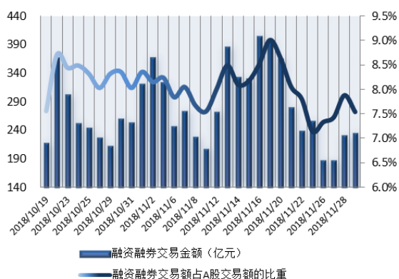
图 1：近三十个交易日融资融券交易金额及占 A 股交易额的比重