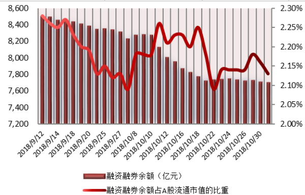
图 1: 近三十个交易日融资融券交易金额及占 A 股交易额的比重 图 2: 近三十个交易日融资融券余额及占 A 股流通市值的比重