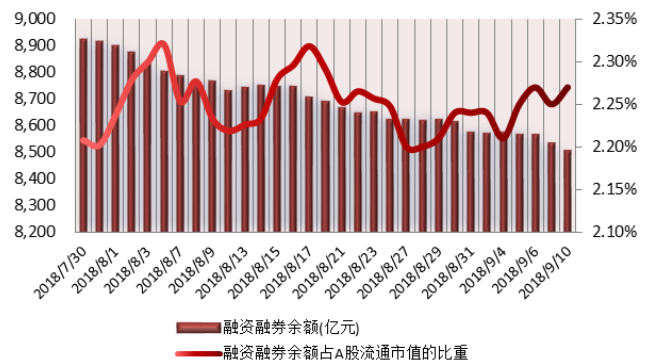
图 2: 近三十个交易日融资融券余额及占 A 股流通市值的比重