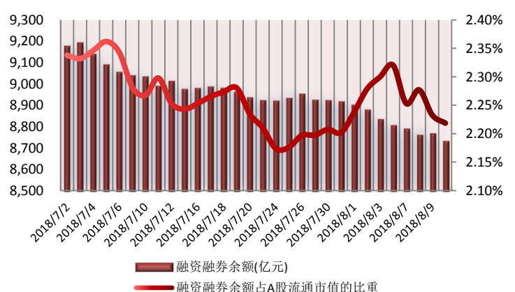
图 2: 近三十个交易日融资融券余额及占 A 股流通市值的比重