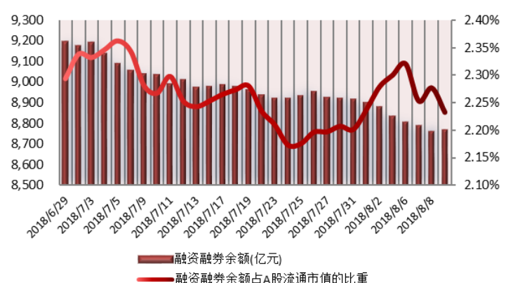
图 1: 近三十个交易日融资融券交易金额及占 A 股交易额的比重