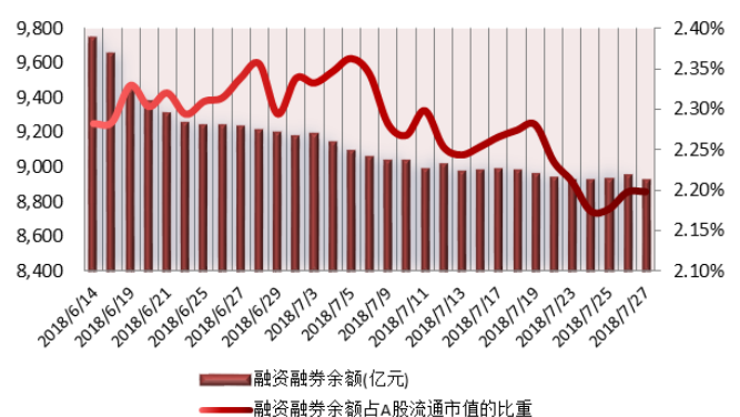
图 2: 近三十个交易日融资融券余额及占 A 股流通市值的比重