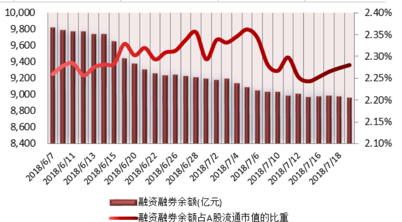
图 2: 近三十个交易日融资融券余额及占 A 股流通市值的比重