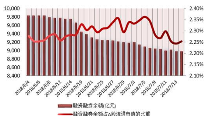
图 2: 近三十个交易日融资融券余额及占 A 股流通市值的比重