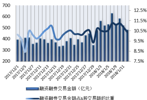
图 1: 近三十个交易日融资融券交易金额及占 A 股交易额的比重