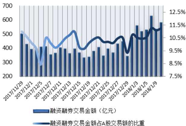
图 1: 近三十个交易日融资融券交易金额及占 A 股交易额的比重