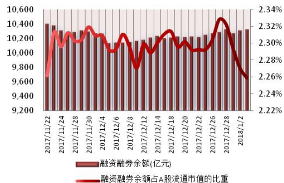
图 1: 近三十个交易日融资融券交易金额及占 A 股交易额的比重