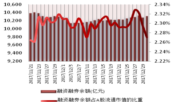
图 1: 近三十个交易日融资融券交易金额及占 A 股交易额的比重