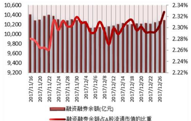
图 2: 近三十个交易日融资融券余额及占 A 股流通市值的比重