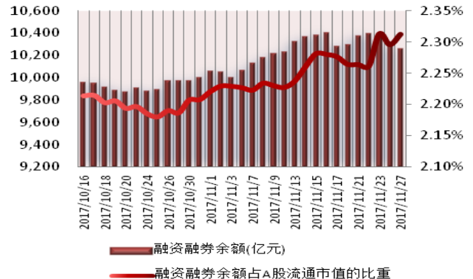
图 2: 近三十个交易日融资融券余额及占 A 股流通市值的比重