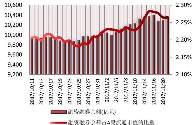
图 2: 近三十个交易日融资融券余额及占 A 股流通市值的比重