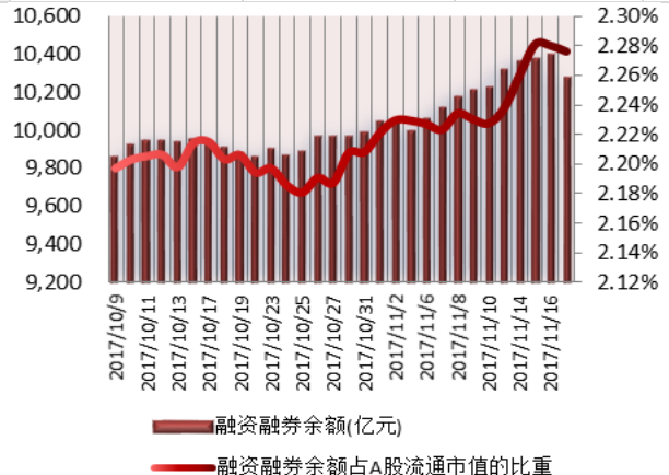
图 2: 近三十个交易日融资融券余额及占 A 股流通市值的比重