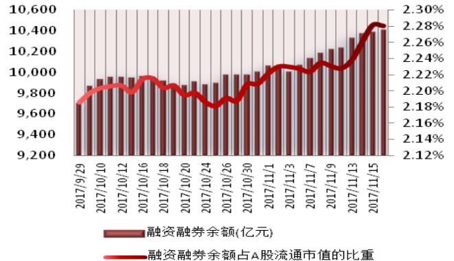
图1：近三十个交易日融资融券交易金额及占A股交易额的比重