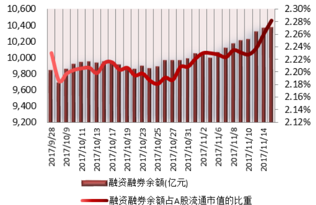
图 2: 近三十个交易日融资融券余额及占 A 股流通市值的比重