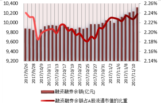
图 1: 近三十个交易日融资融券交易金额及占 A 股交易额的比重