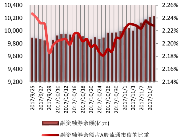
图 2: 近三十个交易日融资融券余额及占 A 股流通市值的比重