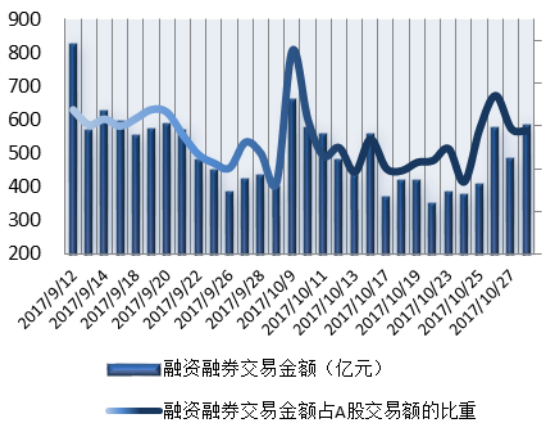
图 1：近三十个交易日融资融券交易金额及占 A 股交易额的比重