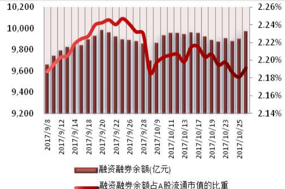
图 1: 近三十个交易日融资融券交易金额及占 A 股交易额的比重