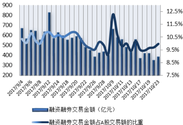
图 1: 近三十个交易日融资融券交易金额及占 A 股交易额的比重