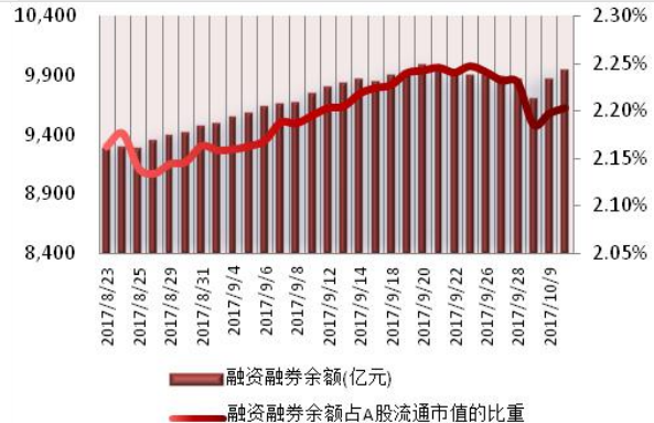
图1：近三十个交易日融资融券交易金额及占A股交易额的比重