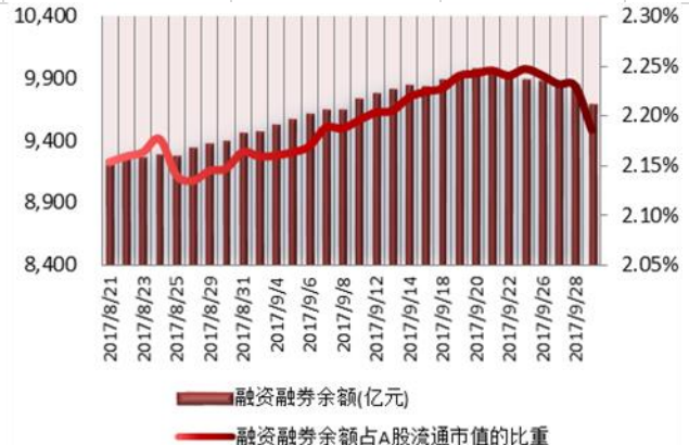
图 1: 近三十个交易日融资融券交易金额及占 A 股交易额的比重