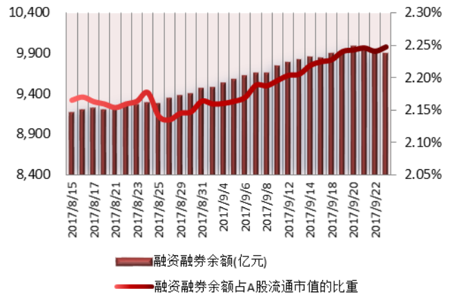
图 2: 近三十个交易日融资融券余额及占 A 股流通市值的比重