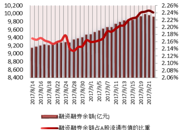
图 1: 近三十个交易日融资融券交易金额及占 A 股交易额的比重