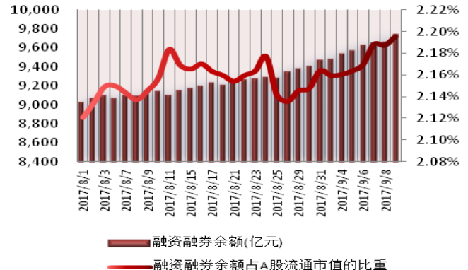
图 1: 近三十个交易日融资融券交易金额及占 A 股交易额的比重