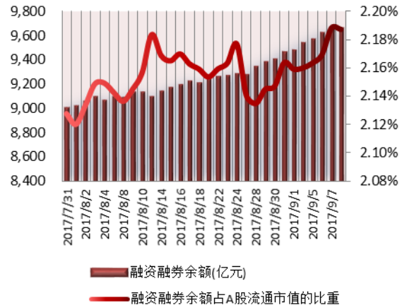
图 1: 近三十个交易日融资融券交易金额及占 A 股交易额的比重