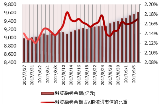
图 2: 近三十个交易日融资融券余额及占 A 股流通市值的比重