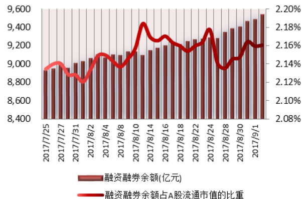
图 2: 近三十个交易日融资融券余额及占 A 股流通市值的比重