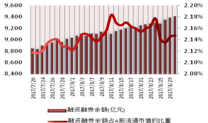
图 1: 近三十个交易日融资融券交易金额及占 A 股交易额的比重