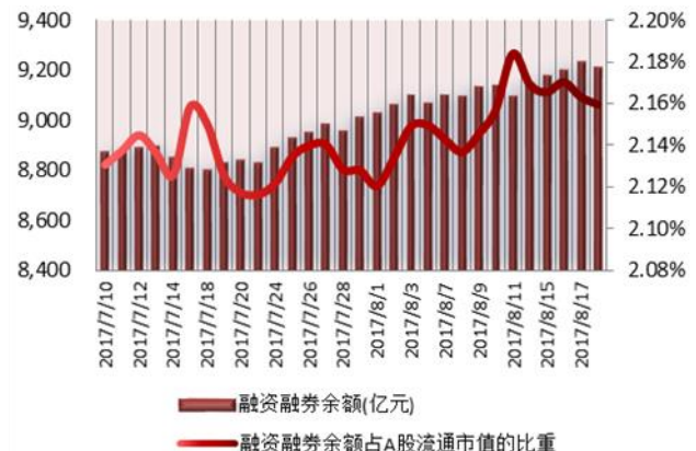
图 2: 近三十个交易日融资融券余额及占 A 股流通市值的比重