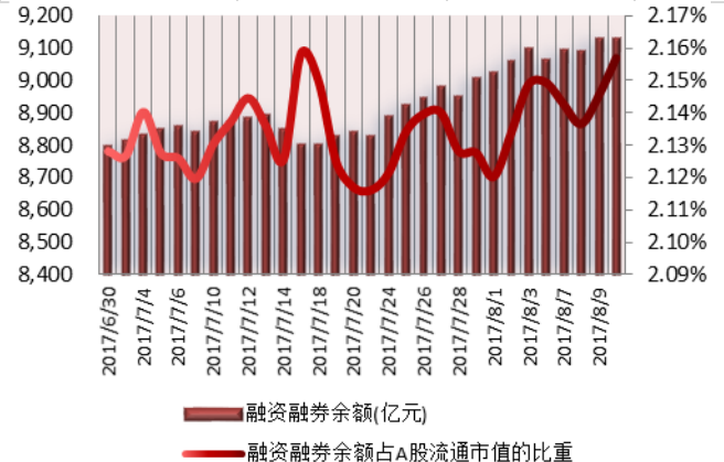
图 1: 近三十个交易日融资融券交易金额及占 A 股交易额的比重