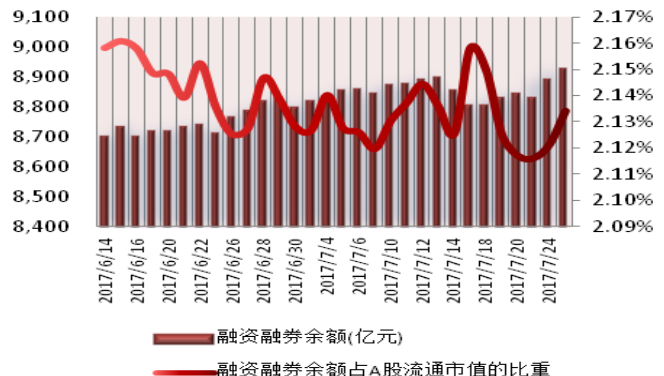
图 2: 近三十个交易日融资融券余额及占 A 股流通市值的比重