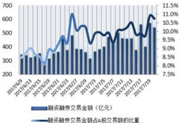
图 1: 近三十个交易日融资融券交易金额及占 A 股交易额的比重