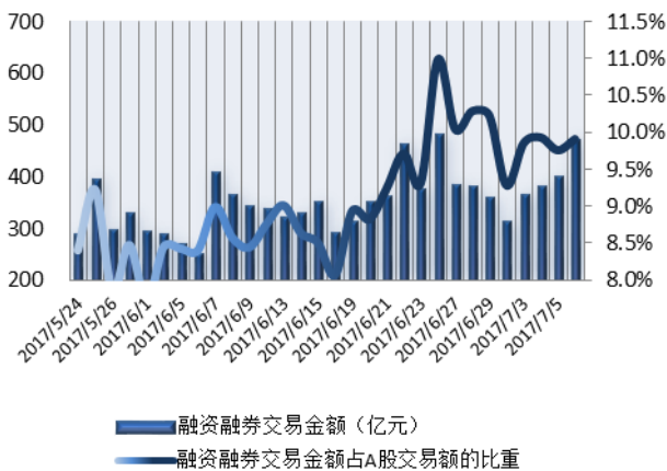
图 1：近三十个交易日融资融券交易金额及占 A 股交易额的比重