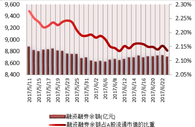
图1：近三十个交易日融资融券交易金额及占A股交易额的比重