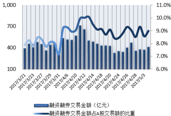
图 1：近三十个交易日融资融券交易金额及占 A 股交易额的比重