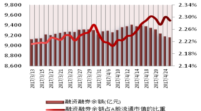
图 2：近三十个交易日融资融券余额及占 A 股流通市值的比重